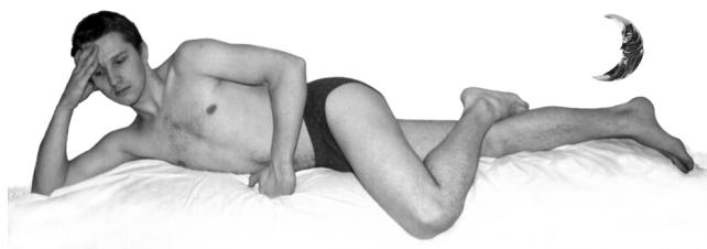
Pozycja oddychania księżycowego — lewa strona ciała (leżymy na prawym boku).

Gaya-Lhama — energia zawarta w przestrzeni, ma cztery stany wibracji, które odpowiadają czterem kolorom, i które są asymilowane z powietrza. Mają one ośrodki w ludzkim ciele i ożywiają je. Te wibracje